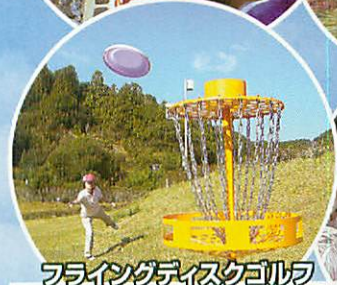
フライングディスクゴルフ