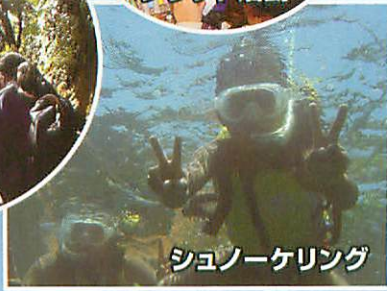
シュノーケリング