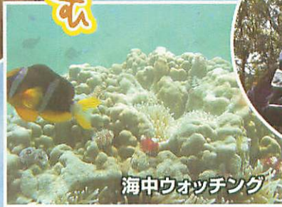
海中ウォッチング