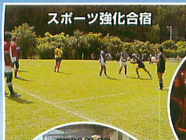
スポーツ強化合宿