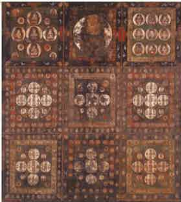
高知県 園分寺 高知県指定文化財《絹本着色 四界曼荼羅のうち金剛界》室町時代