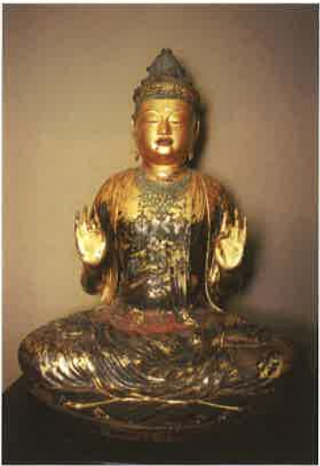
徳島県 東林院 重文《弥勒菩薩坐像》平安時代