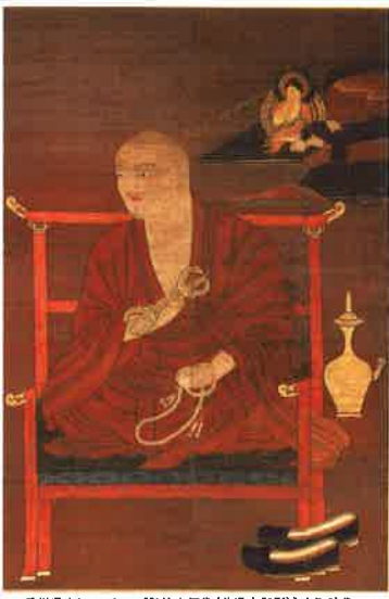
香川県立ミュージアム《弘法大師像(普通寺御影)》室町時代