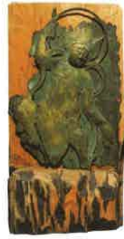
愛媛県横峰寺 聖徳太子文化財(甕土権現尊坐像)平安時代