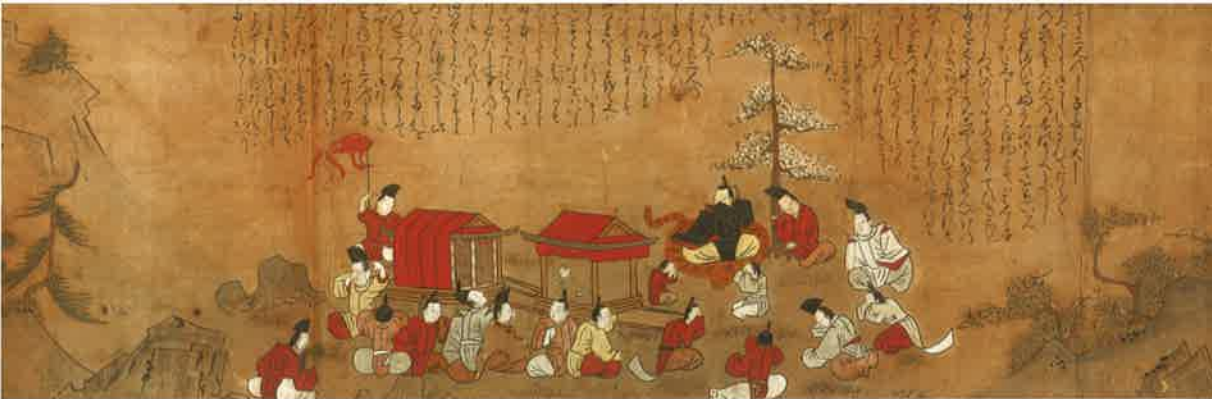
愛媛県 太山寺《阿弥陀の本地》(部分)室町時代