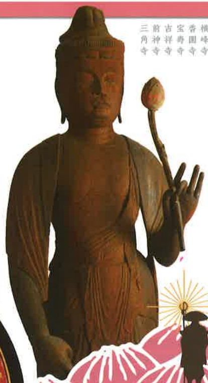
高知県大日寺 重文(大活聖観音立像)平安時代