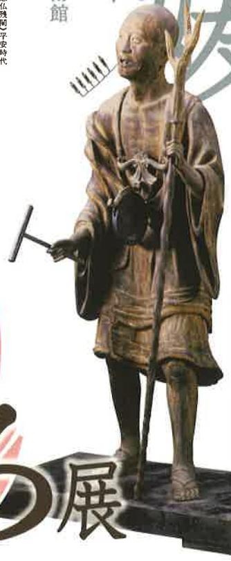
愛媛県宇土寺 重文(坐也上人立像)鎌倉時代