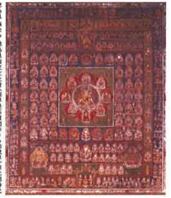
徳島県 徳島市 徳島県指定文化財(阿蘇野原遍路堂のうすじ織物)南北朝時代