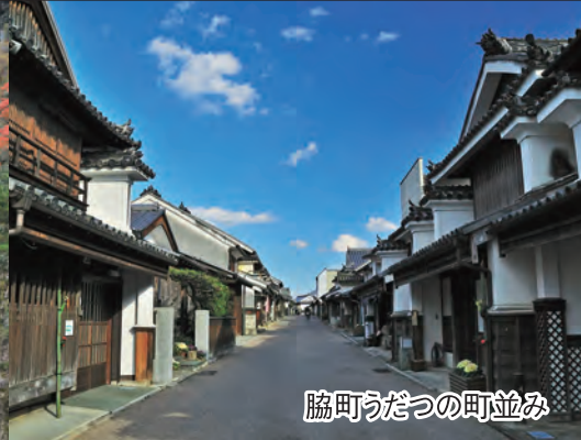
脇町うだつの町並み