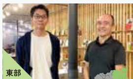
東部 サテライトオフィスコンシェルジュ 特定非営利活動法人 グリーンバレー

「実際に現地を案内してほしい」 「地域課題を確かめたい」 「地元のキーマンと話してみたい」 そんな企業の方向けに、徳島県ならではのコンシェルジュが細やかに対応し、サポートいたします。