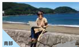
南部 サテライトオフィスコンシェルジュ 株式会社あわせ