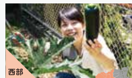
西部 サテライトオフィスコンシェルジュ 有限会社データプロ